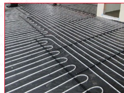
Spezifische Heiz-/Kühlleistung (W/m 2 ) siehe technische Info