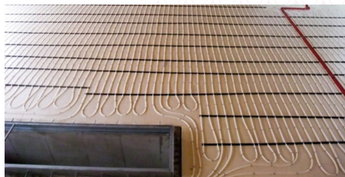
Beispiel: Rohrbefestigung auf der Perimeterdämmung